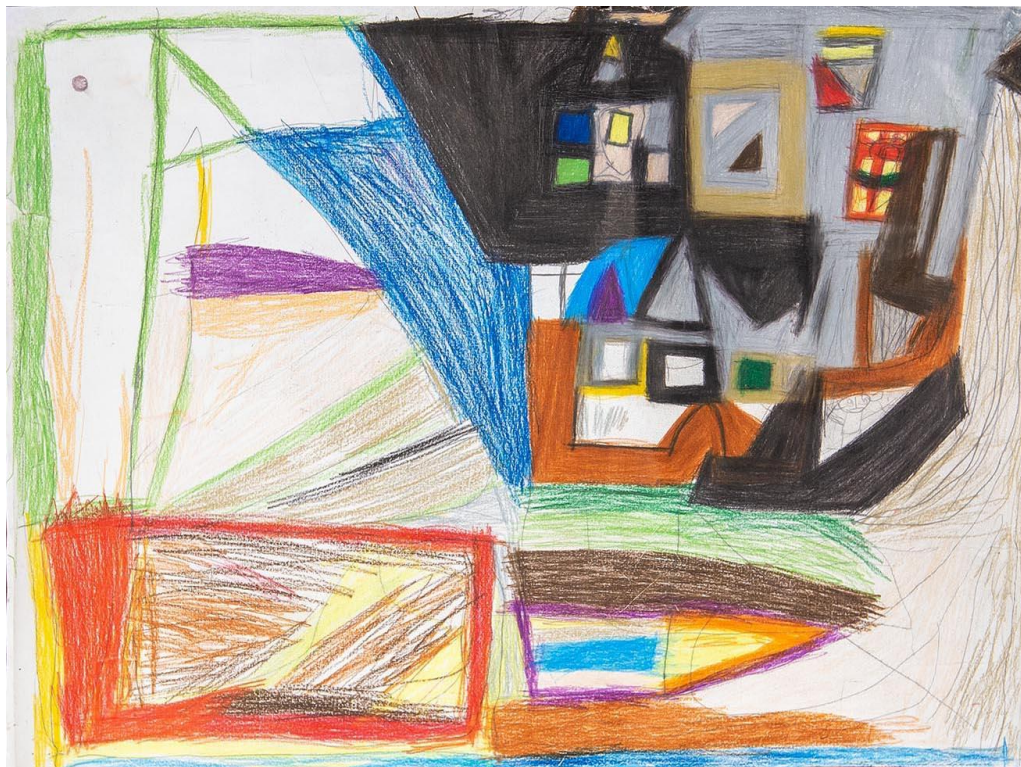
Hotel mit Badewanne und Vollpension, O.D., Buntstift und Bleistift, 51x38

Trägerverein: PS-Art e.V. Berlin Oranienburger Straße 27 10117 Berlin-Mitte