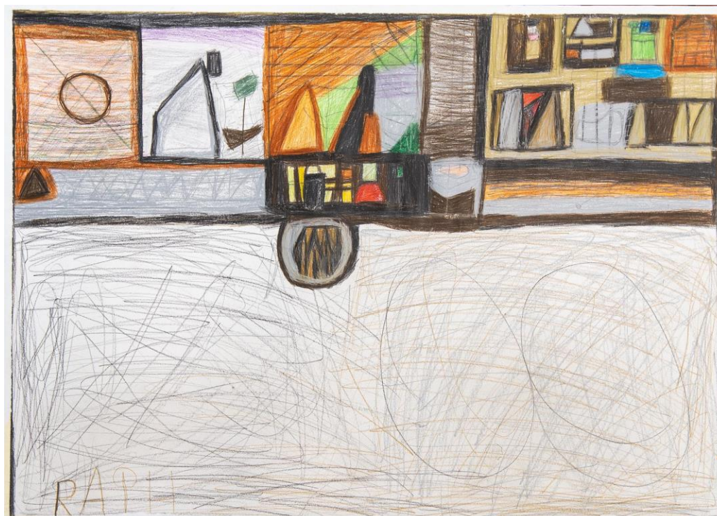
O.T., O.D., Buntstift und Bleistift, 70x50

Trägerverein: PS-Art e.V. Berlin Oranienburger Straße 27 10117 Berlin-Mitte