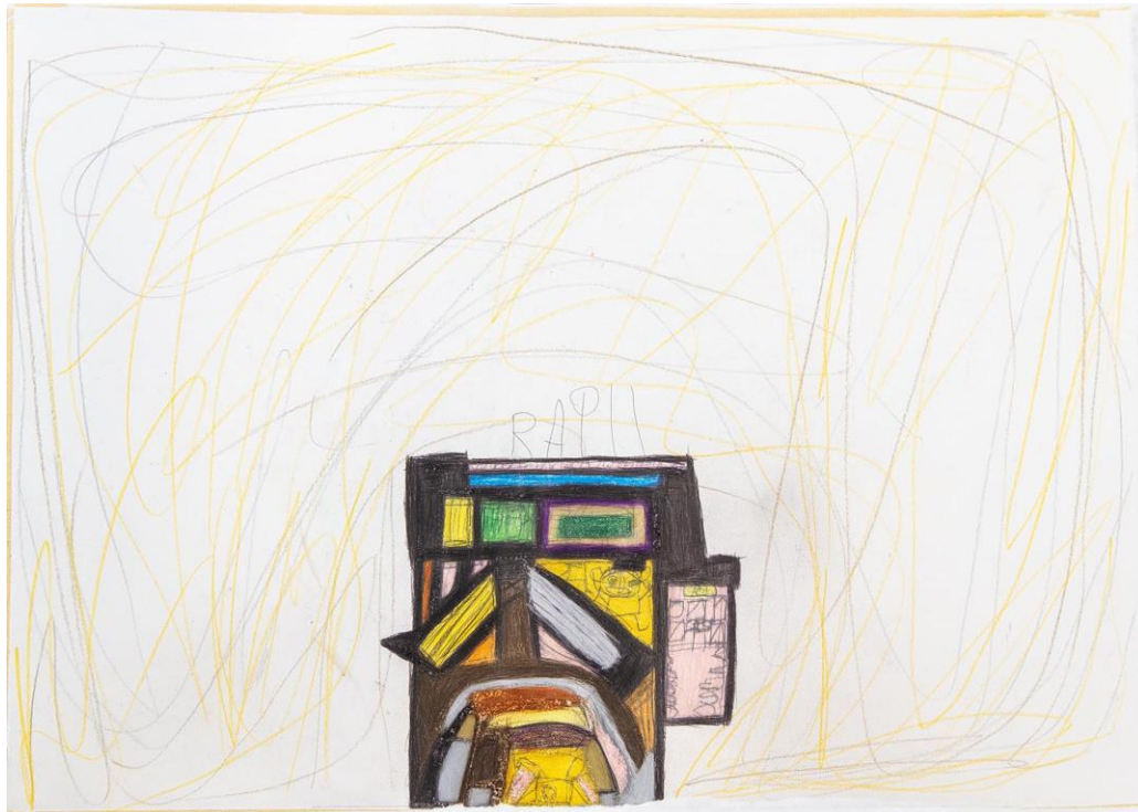
O.T., 2021, Buntstift und Bleistift, 70x50

Für druckfähiges Bildmaterial wenden Sie sich bitte an: galerie@art-cru.de