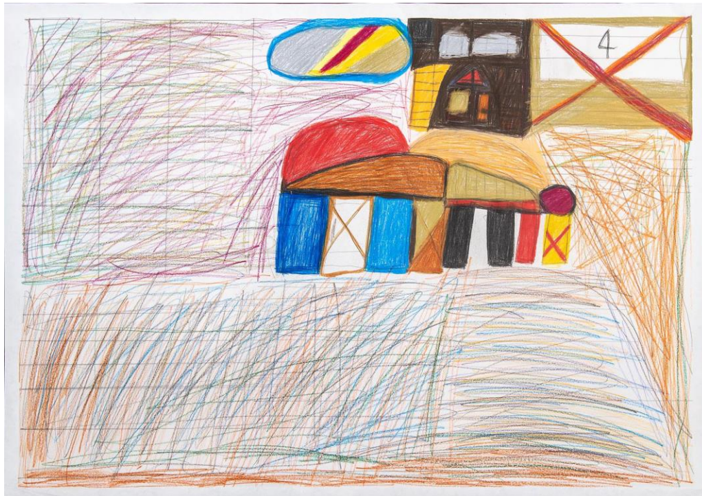
Blitz+Donner, ein Bauernhaus, die Berge, verboten, schwarze Tone und ein Muster, 2019, Buntstift und Bleistift, 70x50